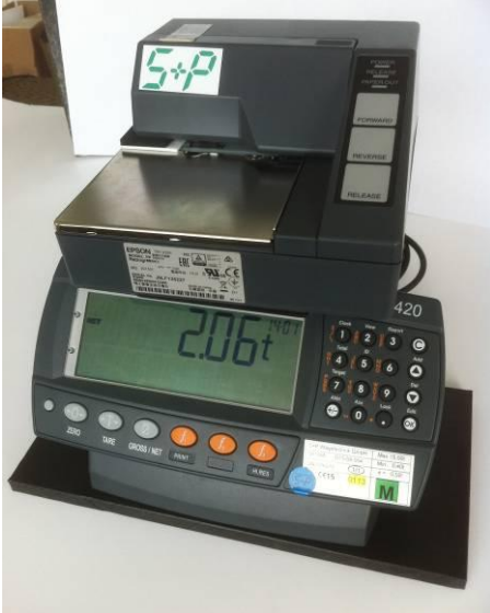
Wägeelektronik mit Drucker Waage nicht aktiv